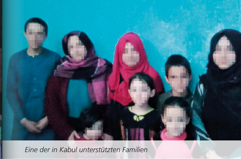
Eine der in Kabul unterstützten Familien